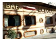
Restaurante La Dorada- Madrid