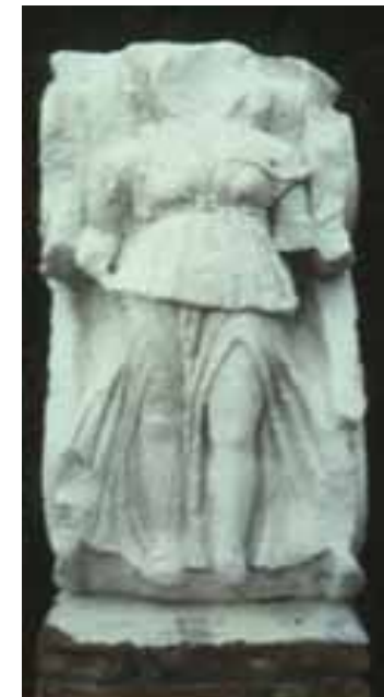
Ménsula con relieve de Victoria. S.II, hallada en c/ Alcazabilla

Las representaciones teatrales estaban ligadas a las festividades religiosas y eran ofrecidas al pueblo por los personajes ricos del municipio. Los primeros teatros romanos eran de madera y portátiles. A partir del siglo I a. C. comienzan a construirse en piedra, tomando como modelo los teatros griegos aunque con algunas variantes. El teatro romano de Málaga sigue las